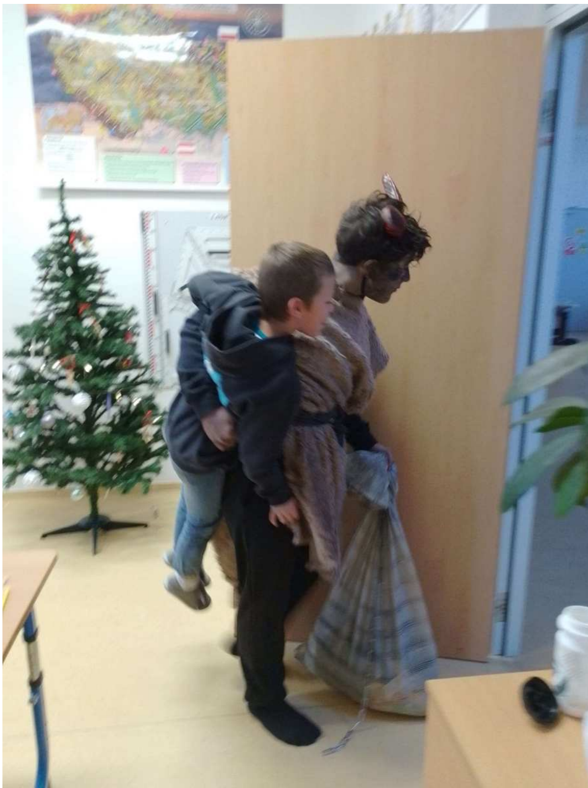
Čert si odnáší jednoho zlobivce s sebou do pekla.