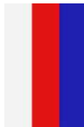
Česká trikolóra svisle

Státní barvy jsou bílá, červená a modrá v uvedeném pořadí.